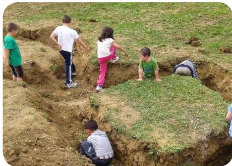
Lakuntzako parke proiektua