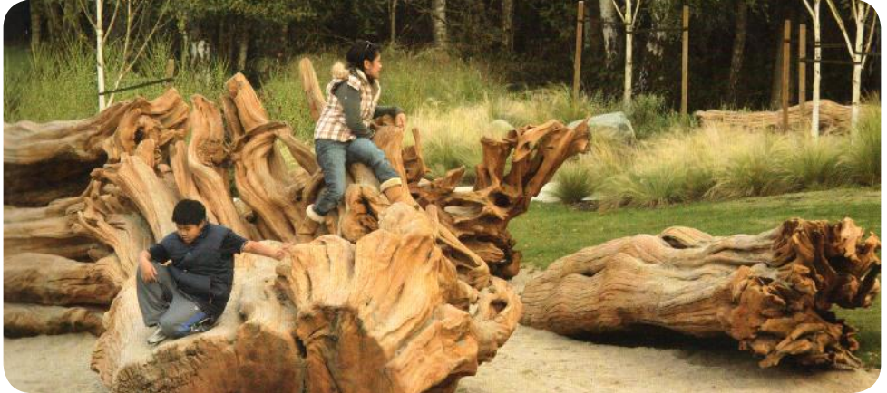
Garden City Park. Richmond, Colombie britannique, Canada.

Sentsibilizazio-saioaren edo saioen ondoren, parkearen sorrera edo eraldaketarako ideiak sortzeko fasea dator.