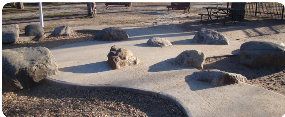
Parc Lafontaine Playground – Montreal, Canada

"Haurrentzat proposatzen den horrek hiritar guztientzat balio du."